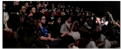
Les élèves au centre culturel de Josselin

Slam inter-collège des troisièmes à Josselin